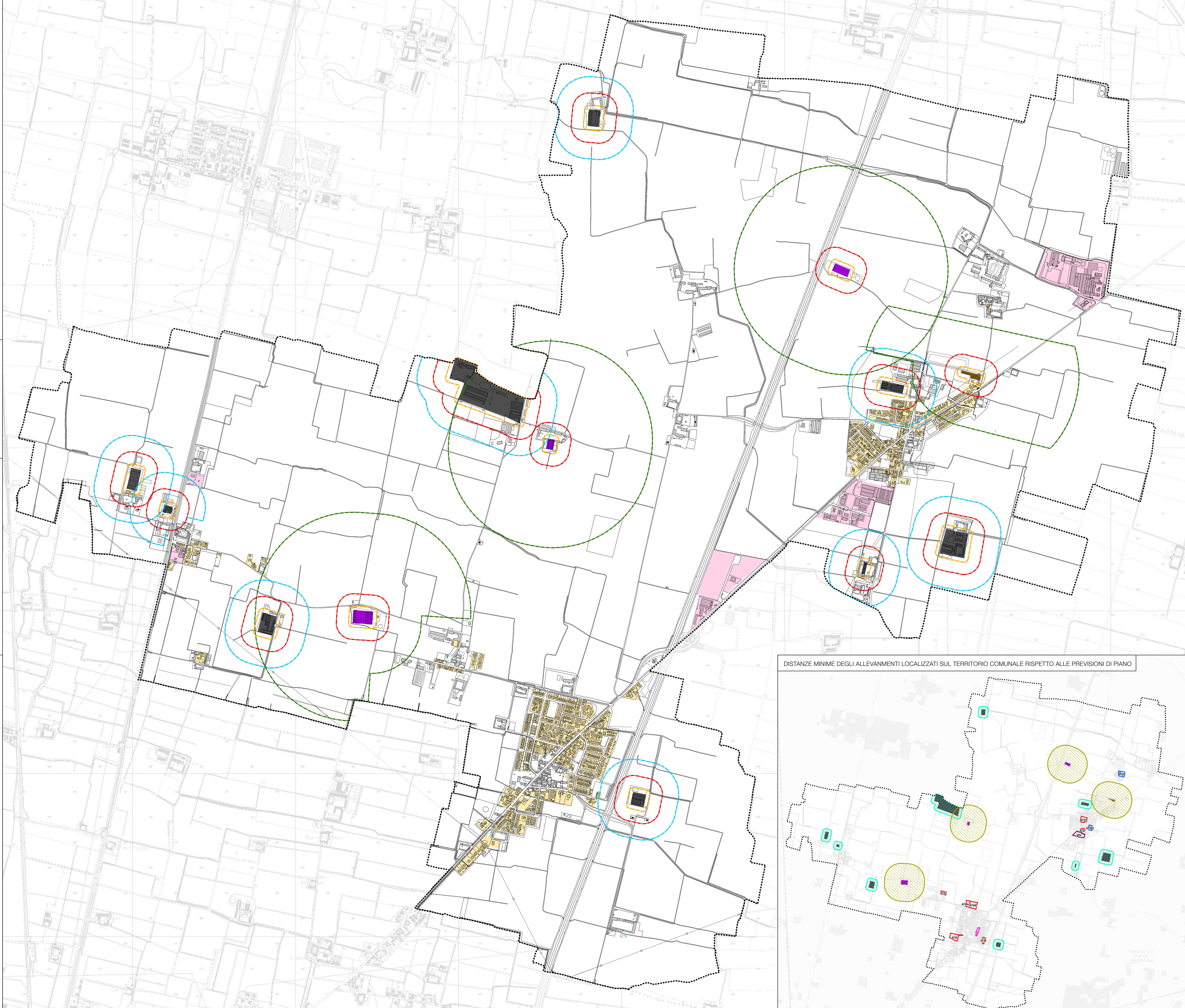
DISTANZE MINIME DEGLI ALLEVAMENTI LOCALIZZATI SUL TERRITORIO COMUNALE RISPETTO ALLE PREVISIONI DI PIANO